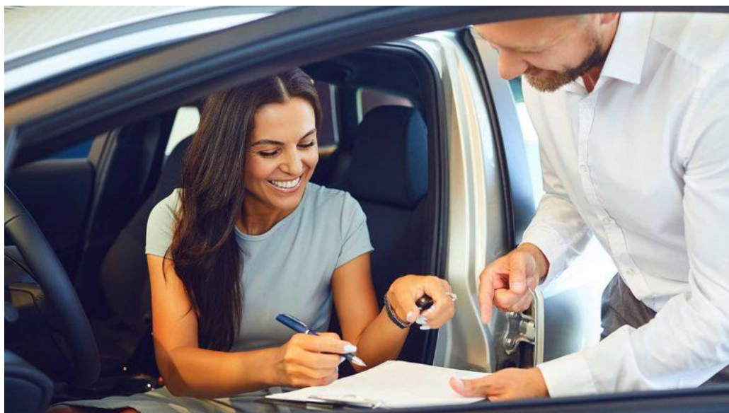
شرایط عمومی ثبت نام سایت سایپا