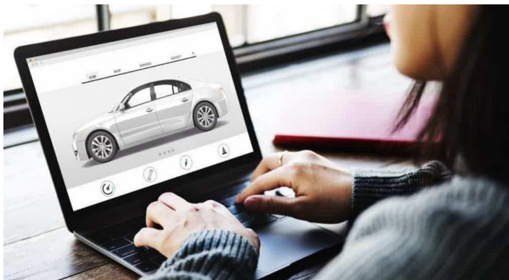
نحوه ثبت نام قرعه‌کشی سایپا